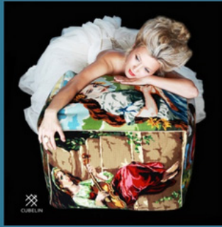
Urban Scents by Marie LeFebvre www.urbanscents.de/de Cubelin by Gabi Becker www.cubelin.com