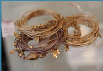
Florentine Prinzessin von und zu Liechtenstein SEA Smadar Eliasaf www.sea-smadar.com AURA Designs www.aura-designs.co.il