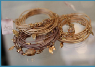
Florentine Prinzessin von und zu Liechtenstein SEA Smadar Eliasaf www.sea-smadar.com AURA Designs www.aura-designs.co.il