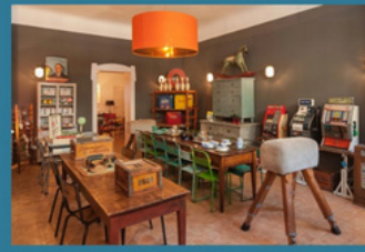
Habibi-Interiors www.habibi-interiors.com Vetternwirtschaft www.vetternwirtschaft.berlin