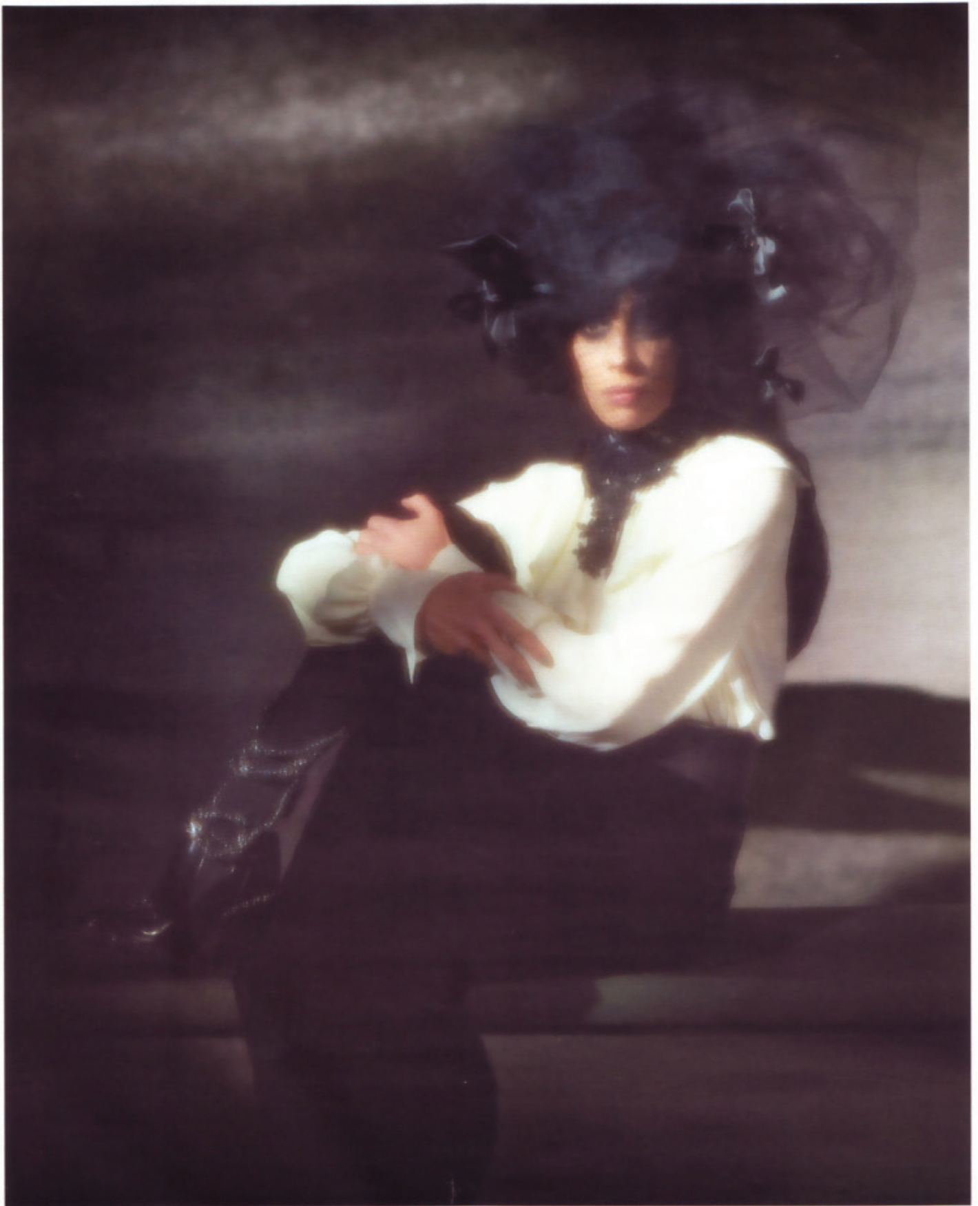
Diese Seite: Seidengeorgettebluse, um 650 €, und Gürtel von PLEIN SUD . Bodenlanger Samtrock von GIORGIO ARMANI . Spitzenkragen: KEX SPITZENKULTUR . Chaps und Boots mit Ketten: CHANEL . Linke Seite: Kaschmirbody mit einem angesetzten Top aus Kaschmir und Seide darunter, um 980 €, von SALVATORE FERRAGAMO . Mermaid-Rock von ZAC POSEN . Gürtel: ANN DEMEULEMEESTER . Weißes Spitzenhalsband: privat. Tahitiperlenkette: SCHOEFFEL .