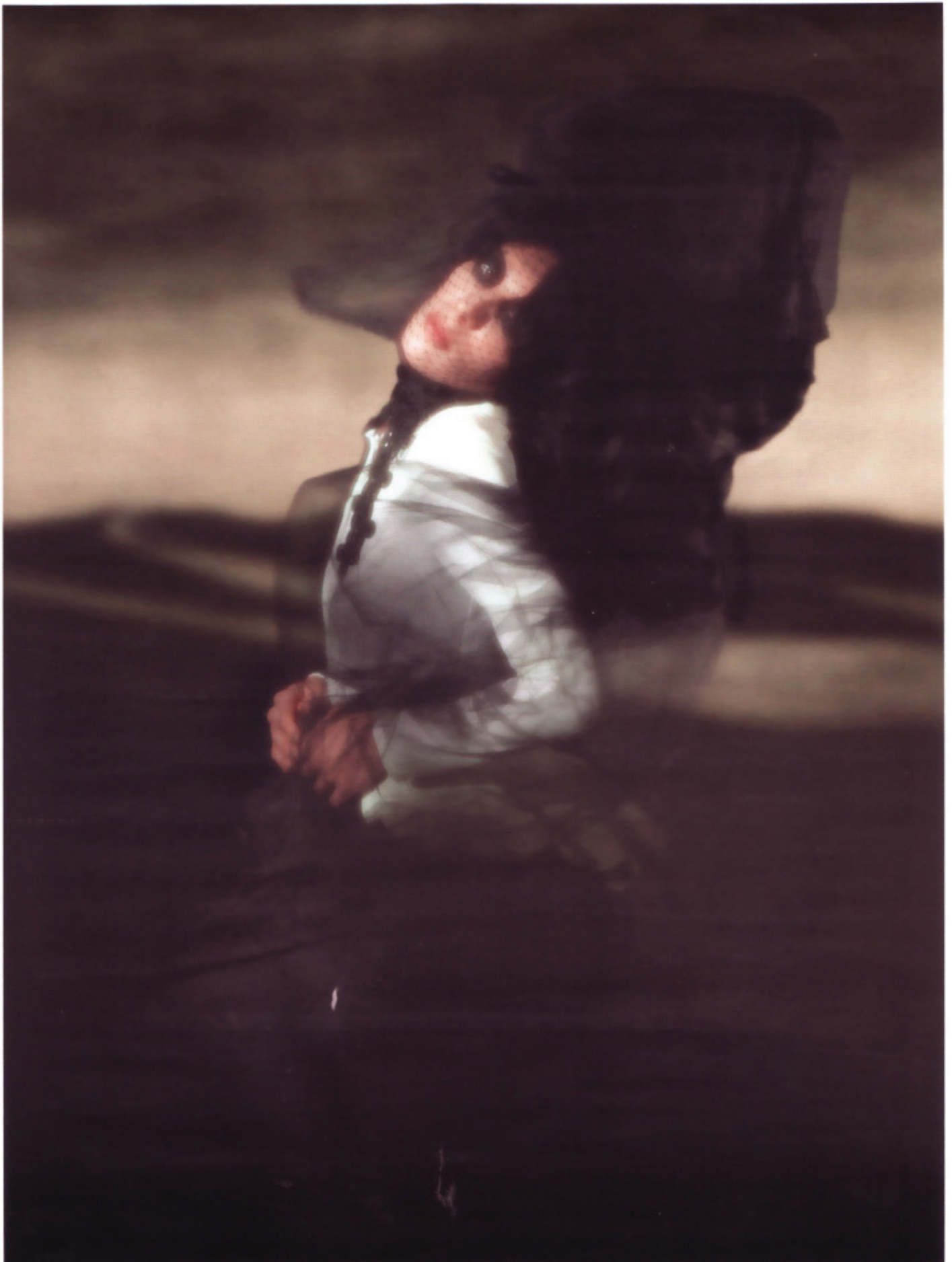
Bluse aus Seidencrepe mit schwarzem Samtgürtel, um 955 €, und bodenlanger Kaschmirrock mit Quernaht, um 830 €, von ALBERTA FERRETTI . Spitzenkragen: KEX SPITZENKULTUR .